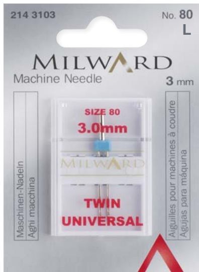
▲ 214 3103