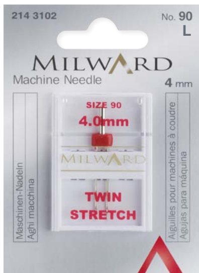
▲ 214 3102