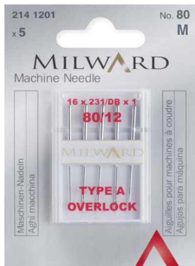
▲ 214 1201