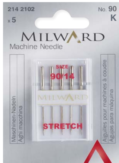
▲ 214 2102