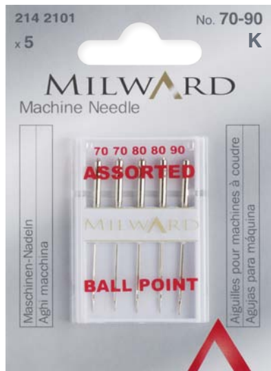
▲ 214 2101