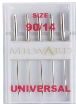
▲ 214 1114