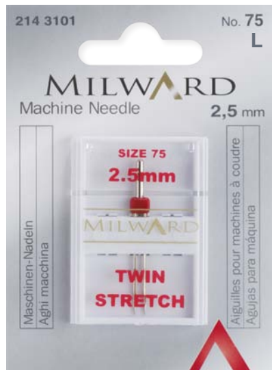
▲ 214 3101