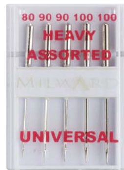
▲ 214 1117