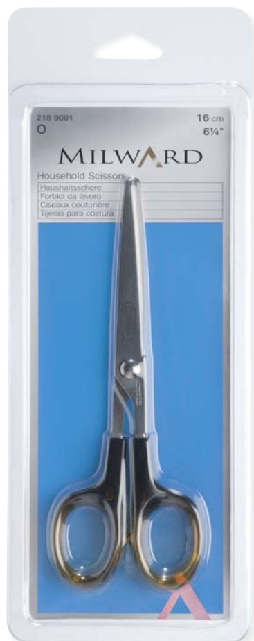
▲ 218 9001