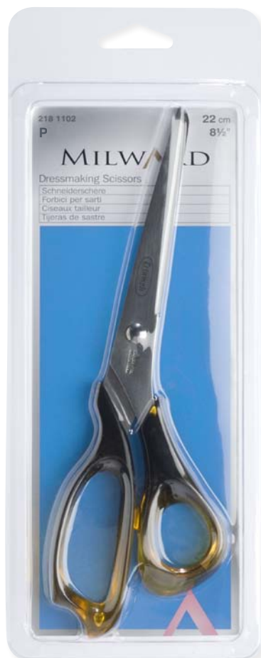
▲ 218 1102