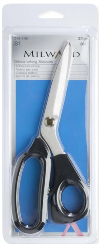
▲ 218 1101