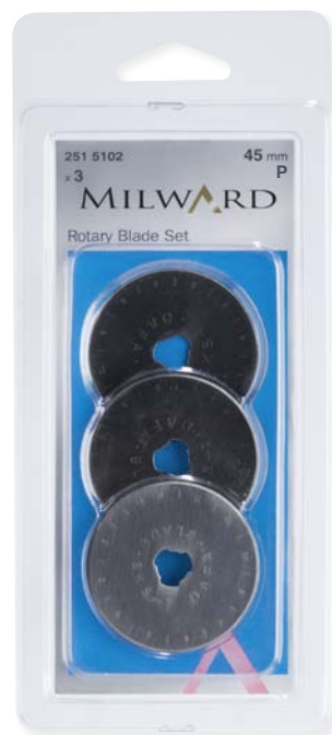
▲ 251 5102