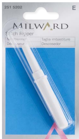
▲ 251 5202