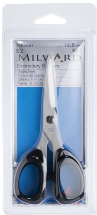
▲ 218 2101