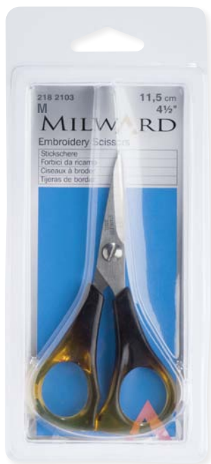
▲ 218 2103