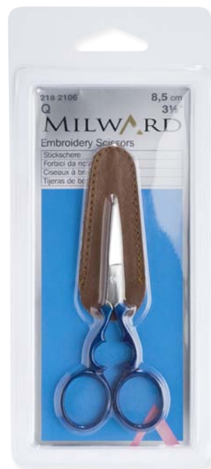
▲ 218 2106