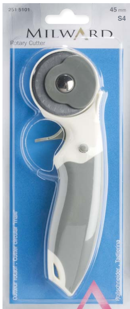
▲ 251 5101