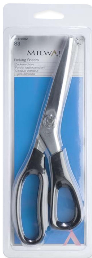
▲ 218 9002