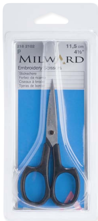
▲ 218 2102