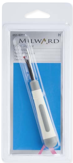
▲ 251 5201