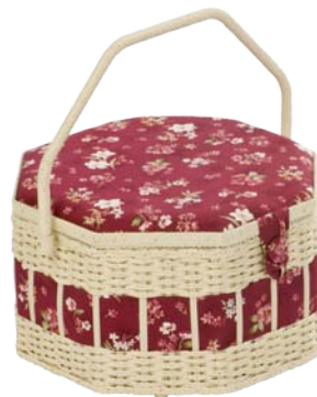
▲ 224 1211