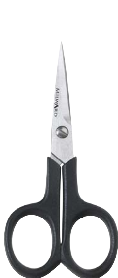
▲ 218 2107