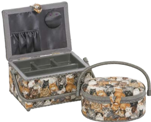
▲ 224 1201 ▲ 224 1204