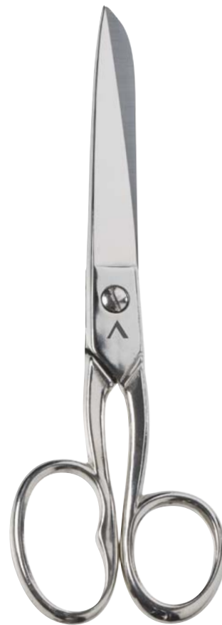
▲ 218 3103