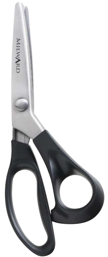
▲ 218 9004