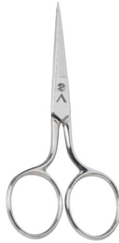
▲ 218 2113