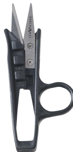
▲ 218 9003