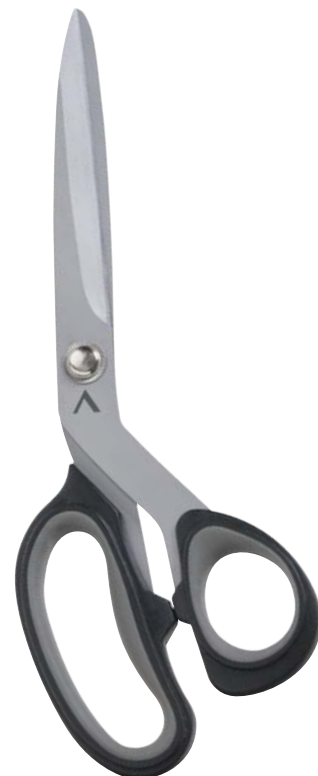
▲ 218 1108