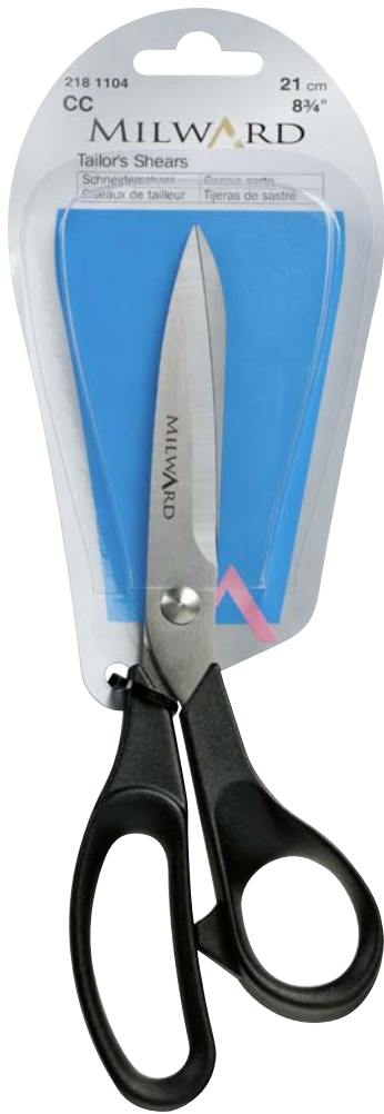
▲ 218 1104