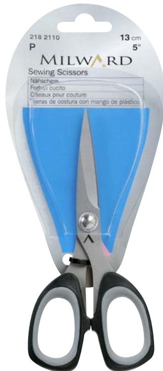
▲ 218 2110