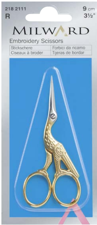
▲ 218 2111