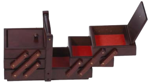
▲ 224 1102