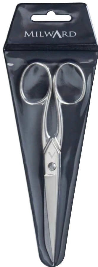
▲ 218 3101