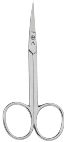
▲ 218 2112