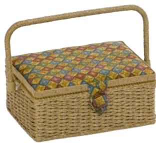
▲ 224 1208