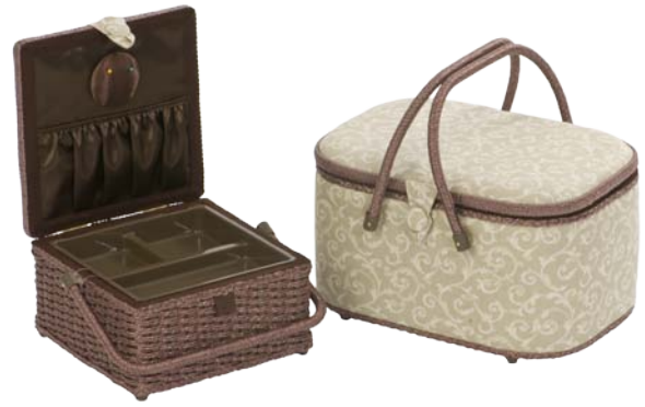
▲ 224 1206 ▲ 224 1209