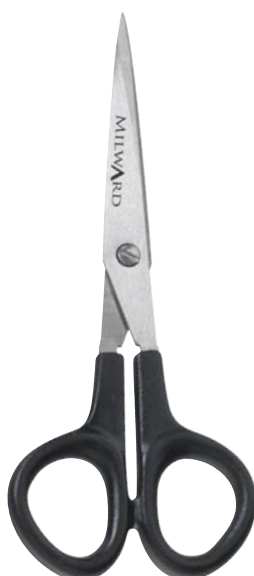
▲ 218 2109