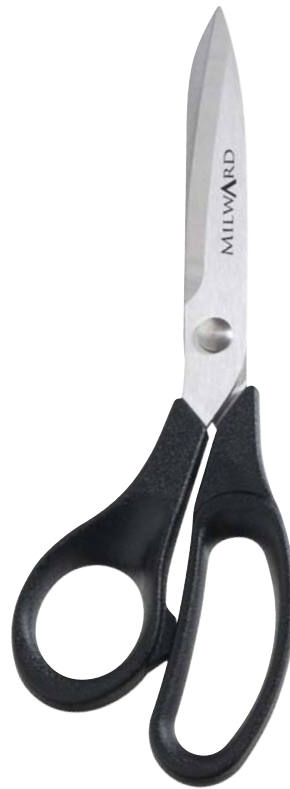
▲ 218 1106