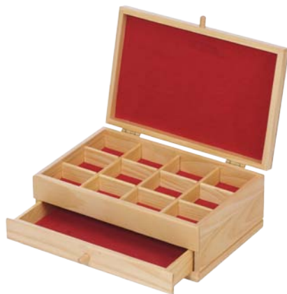
▲ 224 1105