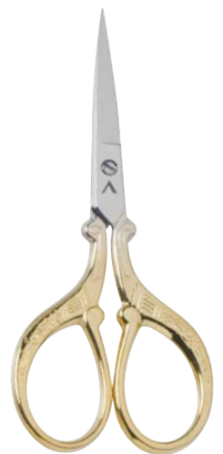
▲ 218 2114