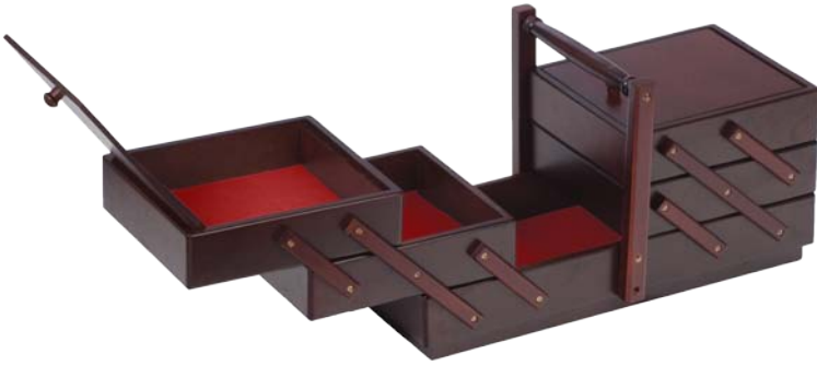
▲ 224 1104