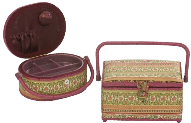
▲ 224 1205 ▲ 224 1203