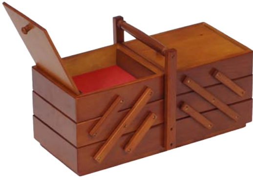
▲ 224 1103