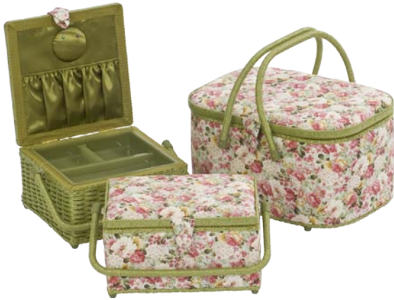
▲ 224 1207 ▲ 224 1202 ▲ 224 1210